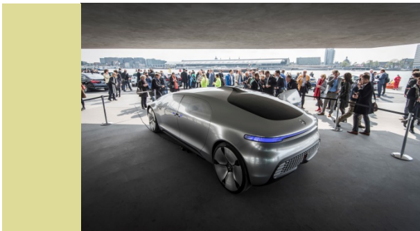
Sehen so die Fahrzeuge der Zukunft aus? Bei der EU-Verkehrsminister-Konferenz 2016 in Amsterdam stellte Daimler sein Forschungsfahrzeug F015 aus.

Beinahe täglich begegnet uns das Thema automatisiertes bzw. autonomes Fahren in den Medien und in öffentlichen Diskussionen. Immer wieder werden einzelne Fortschritte präsentiert und technische Neuerungen angekündigt, die in Kürze in Serie gehen sollen. Daneben gibt es bereits eine Reihe von Assistenzsystemen am Markt; allesamt Wegbereiter hin zum vollautomatisierten bzw. autonomen Fahren. Aber warum werden so häufig diese unterschiedlichen Begriffe verwendet? Wie werden sich die technische Entwicklung und parallel dazu die rechtliche und ethische Diskussion nach aktuellem Stand wahrscheinlich darstellen? Und schließlich ist damit auch untrennbar die Frage nach der Zukunft der Kraftfahrtversicherung verknüpft.